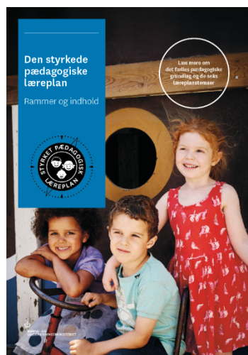
Den styrkede pædagogiske læreplan. Rammer og indhold

Denne skabelon indeholder alle de lovmæssige krav til evalueringen. Lovkravene finder I i de to midterste afsnit "Evaluering og dokumentation" og "Inddragelse af forældrebestyrelsen". Skabelonen indeholder desuden spørgsmål, som kan støtte jeres evalueringsproces samt jeres fremadrettede arbejde med løbende at revidere den skriftlige læreplan.